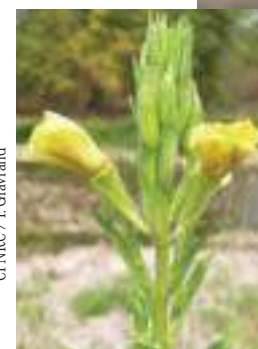
CPNRC / I. Gravrand