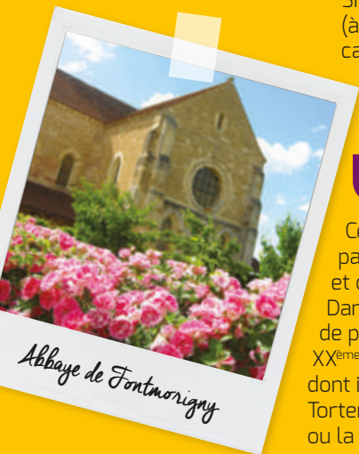
Abbaye de Fontmorigny

Entre le Bec d'Allier qui scelle la réunion des eaux de la Loire et de l'Allier et annonce la "Loire des îles et des méandres", puis le port fluvial de Marseilles-lès-Aubigny, vous parcourez le chemin de halage du canal latéral à la Loire et les levées qui corsettent le fleuve. Celui-ci s'offre à votre vue en quelques endroits privilégiés. Si le fleuve n'est plus navigable (à l'exception des canoës), le canal est encore fréquenté par des bateaux de plaisance qui manoeuvrent régulièrement aux écluses.