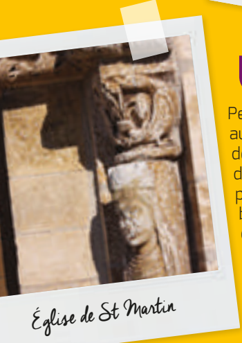
Église de St Martin

Petit bourg groupé autour de son église de style roman datant du XIII ème siècle, dont le portail comporte deux belles statues-colonnes et le motif d'une chouette fréquemment utilisé par les artistes du Moyen Age.