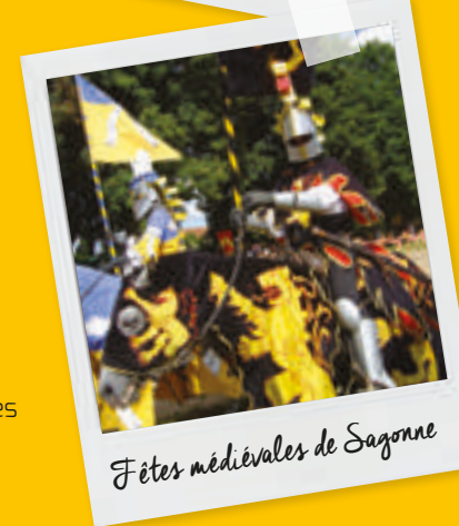
Fêtes médiévales de Sagonne