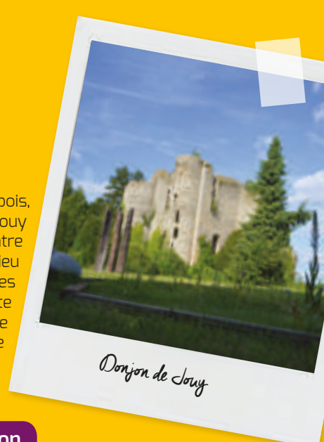
Donjon de Jouy

Dominant la vallée de l'Aubois, le parc du donjon de Jouy est un lieu de rencontre entre l'art et la nature. Lieu d'exposition de sculptures contemporaines, il abrite également une richesse faunistique et floristique exceptionnelle.