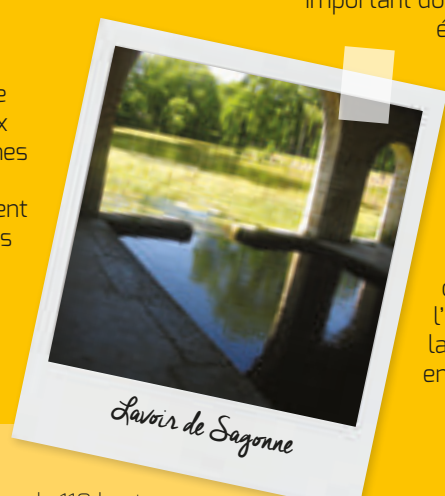
Lavoir de Sagonne

élégante tour d'escalier. Le lavoir, situé à l'entrée du village, a une forme presque carrée, et non rectangulaire comme à l'habitude, et de larges ouvertures en arcades.