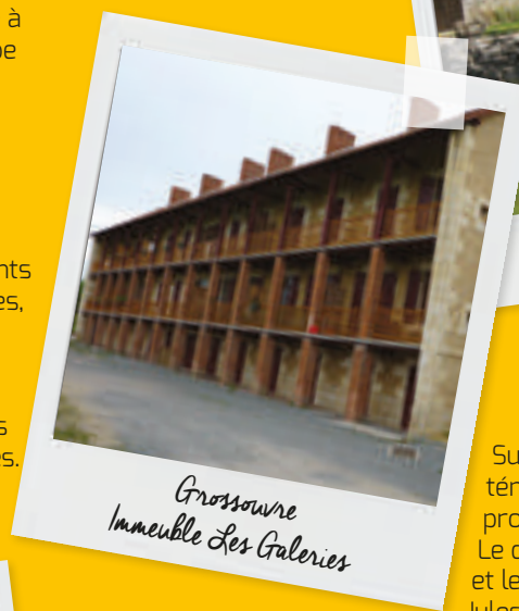
Grossouvre Immeuble Les Galeries

Riche d'un patrimoine industriel unique, la commune de Grossouvre abrite la dernière halle à charbon de bois de type Galloise, récemment réhabilitée en centre d'interprétation pour le grand public sur les grandes étapes de la fabrication du fer, et l'immeuble de logements ouvriers dit Les Galeries, construit en 1833 pour accueillir la main d'œuvre industrielle. Tous deux sont classés monuments historiques.