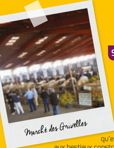
Marché des Grivelles