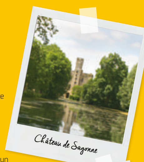
Château de Sagonne

Surplombé par son château, le village témoigne de la période de grande prospérité connue au Moyen Age. Le château, construit entre le XII ème et le XV ème siècle, fut la propriété de Jules Hardouin-Mansart, architecte de Versailles. Aujourd'hui, il conserve une partie de son enceinte fortifiée, un important donjon et une