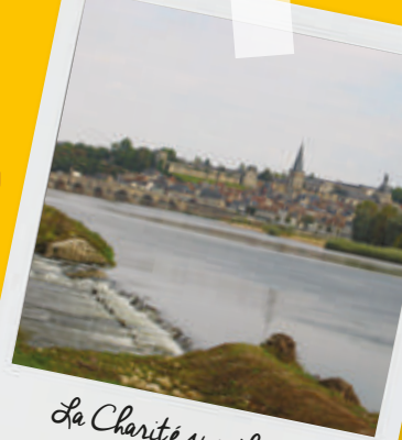
La Charité sur Loire

Historiquement située aux limites de la Bourgogne et du Berry, elle s'est développée autour d'un prieuré clunisien et de deux églises érigées par les moines en 1059, le tout protégé par des remparts et tours de ronde.