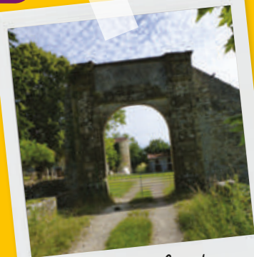
Vieux château Charentonnay

Situé sur le cours de la Vauvise, ce lavoir a été construit à la fin du XIX ème siècle. Illustrant le mouvement hygiéniste qui s'invite alors dans les campagnes françaises, l'ouvrage est de construction simple.