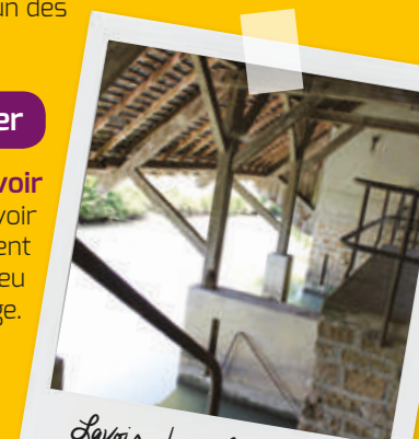
Lavoir Jussy le Chaudrier

Construit sur la berge de la Vauvise, ce lavoir date de la fin du XIX ème siècle. Exclusivement réservé aux femmes, l'ouvrage était un lieu propice à la convivialité et à l'échange.