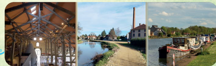
Grossouvre La Guerche-sur-l'Aubois Marseilles-lès-Aubigny

Le long du canal de Berry, explorez le patrimoine industriel du passé et les artisans qui animent le présent