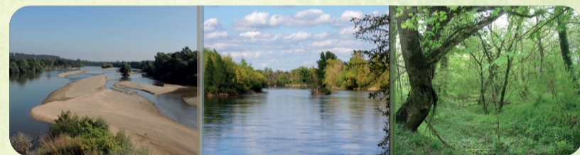
Cuffy Marseilles-lès-Aubigny Herry

Découvrez les panoramas ligériens, villages de mariniers, et espaces naturels aux patrimoines vivants uniques