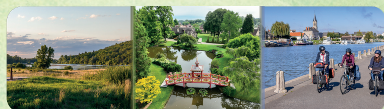
Cuffy Apremont-sur-Allier Marseilles-lès-Aubigny