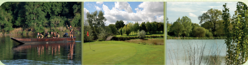
Cuffy Saint-Hilaire-de-Gondilly Précý

Marchez, bougez, naviguez... la nature préservée vous invite à la découverte