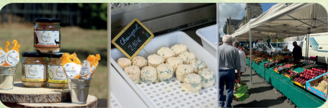
Lugny-Champagne Ignol Sancoins

Partez à la rencontre des saveurs locales, des producteurs aux marchés et des savoir-faire culinaires