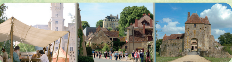
Sagonne Apremont-sur-Allier Mornay-Berry

Parcourez nos villages et jardins remarquables où l'histoire et la beauté des lieux se révèlent à chaque pas