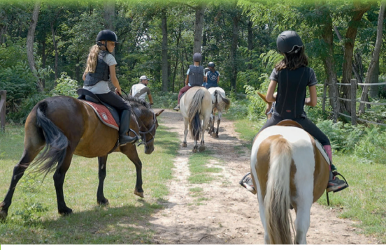
Aire de repos - Ignol